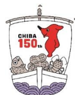
千葉県マスコットキャラクター チーバくん