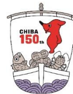
千葉県マスコットキャラクター チーバくん

千葉県建築文化賞は、まちなみや周辺の景観との調和、安全で快適な建築空間の創出等において先導的で質の高い優れた建築物を表彰することにより、建築文化、居住環境に対する県民の意識を高め、うるおいとやすらぎに満ちた快適なまちづくりを進めていくことを目的に実施するものです。