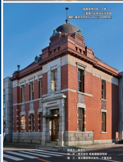
一般建築物の部 入賞 三峯銀行新築本店旧本館