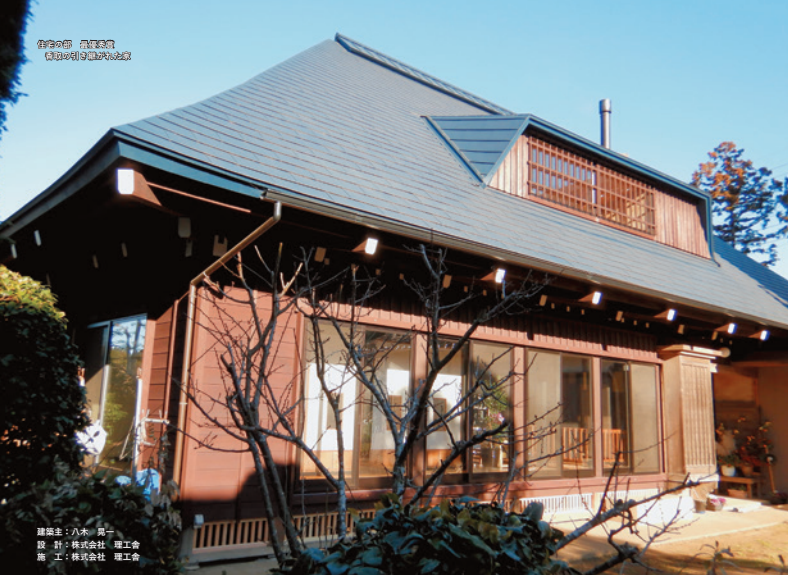
住宅の部 入賞 建築/引野田大祐