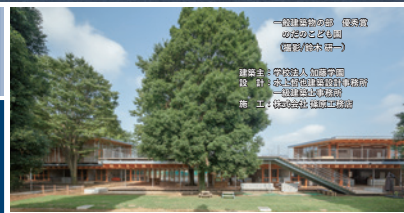
一般建築物の部 顕著賞 のぶのぶ賞