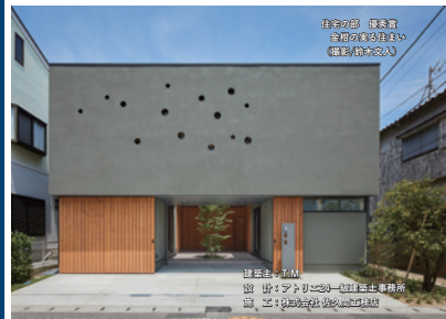
住宅の部 顕著賞 全日本建築文化賞