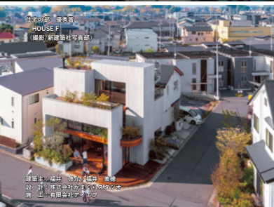
住宅の部 顕著賞 HOUSE F (撮影/新建築社写真部)