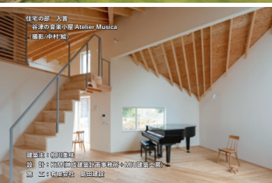
住宅の部 入賞 音楽の森 小澤 Atelier Musica