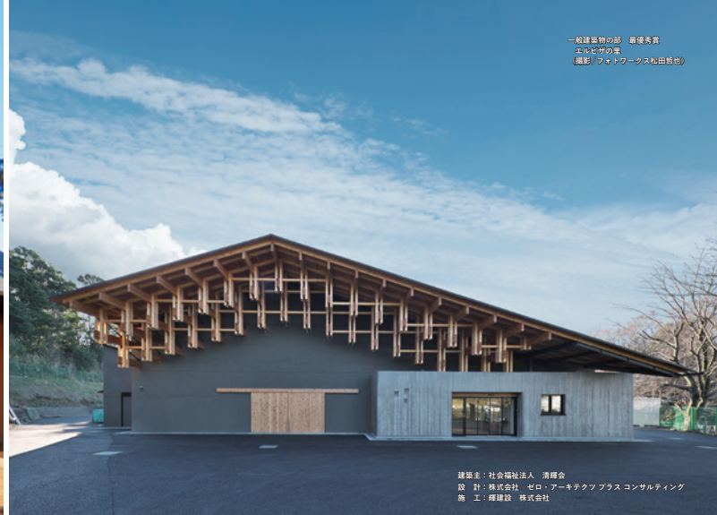
一般建築物の部 顕著賞 エピソード賞