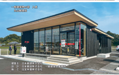
一般建築物の部 入賞 丸山彰徳賞