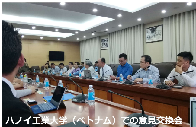
ハノイ工業大学（ベトナム）での意見交換会