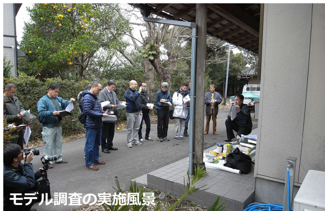
モデル調査の実施風景